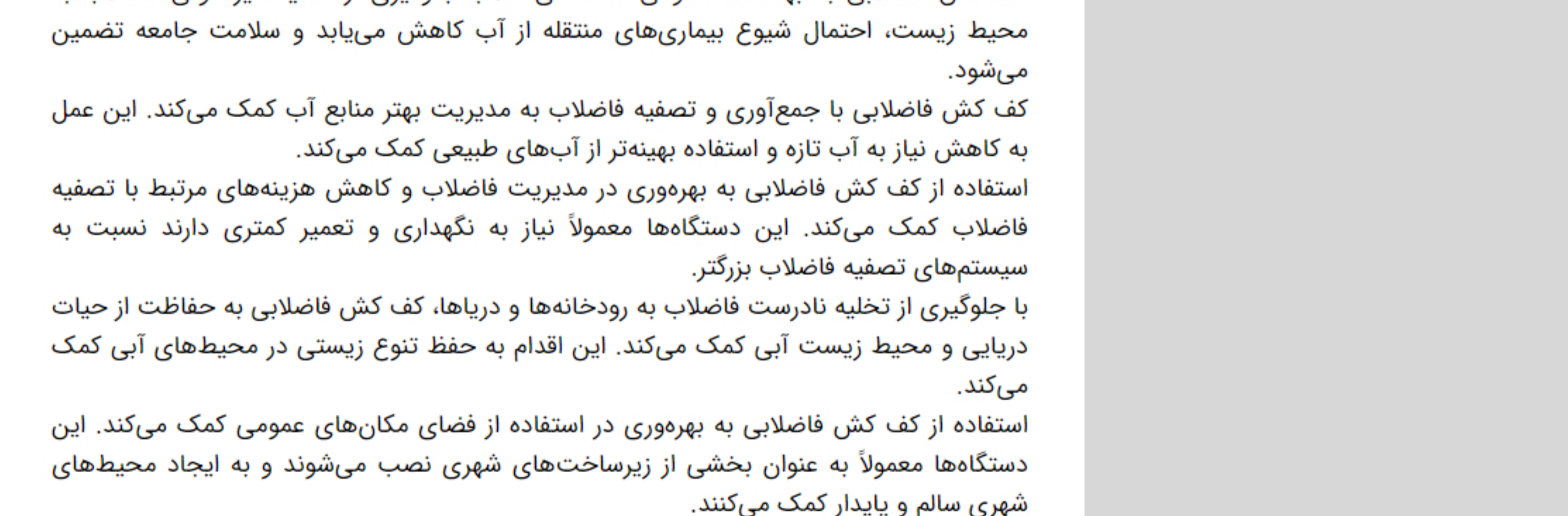
نکات تکمیلی در خصوص نصب و نگهداری کف کش فاضلابی چیست؟

نصب و نگهداری کف کش فاضلابی نیاز به رعایت نکات خاصی دارد تا از کارایی و عمر مفید این تجهیزات حفاظت شود. در ادامه به برخی نکات تکمیلی در خصوص نصب و نگهداری کف کش فاضلابی اشاره می‌کنیم: نصب کف کش فاضلابی باید توسط متخصصین ماهر و با رعایت دقیق دستورالعمل‌ها انجام شود. انتخاب مکان مناسب برای نصب و تعیین ارتفاع و شیب صحیح از جمله موارد حیاتی در نصب می‌باشد. کف کش فاضلابی نیاز به تعمیرات دوره‌ای دارد. لوله‌ها و قطعات آن باید به صورت منظم بررسی و در صورت نیاز تعمیر شوند تا از عملکرد بهینه تجهیزات اطمینان حاصل شود. تعمیر و نگهداری: کف کش فاضلابی باید به دور از گرفتگی و انسداد باقی بماند. بنابراین، تمیزی منظم و ایمنی در ایندها از کف کش فاضلابی ضروری است. رعایت بهداشت: هنگام نصب و تعمیر کف کش فاضلابی، ایمنی کارکنان را در نظر بگیرید. استفاده از وسایل حفاظتی مانند کلاه‌شروع، عینک ایمنی و دستکش‌ها ضروری است. برنامه‌ریزی نگهداری دوره‌ای: تعیین یک برنامه نگهداری برای نگهداری و تعمیرات کف کش فاضلابی به کاهش هزینه‌ها و جلوگیری از مشکلات ناگهانی کمک می‌کند. آموزش کارکنان: کارکنان مسئول نگهداری باید آموزش‌های مربوط به عملیات و نگهداری صحیح کف کش فاضلابی را دریافت کنند. رعایت این نکات تکمیلی در نصب و نگهداری کف کش فاضلابی به بهبودی و عمر طولانی‌تر این تجهیزات کمک می‌کند و از مشکلات ناشی از نقصان در عملکرد آنها جلوگیری می‌کند.