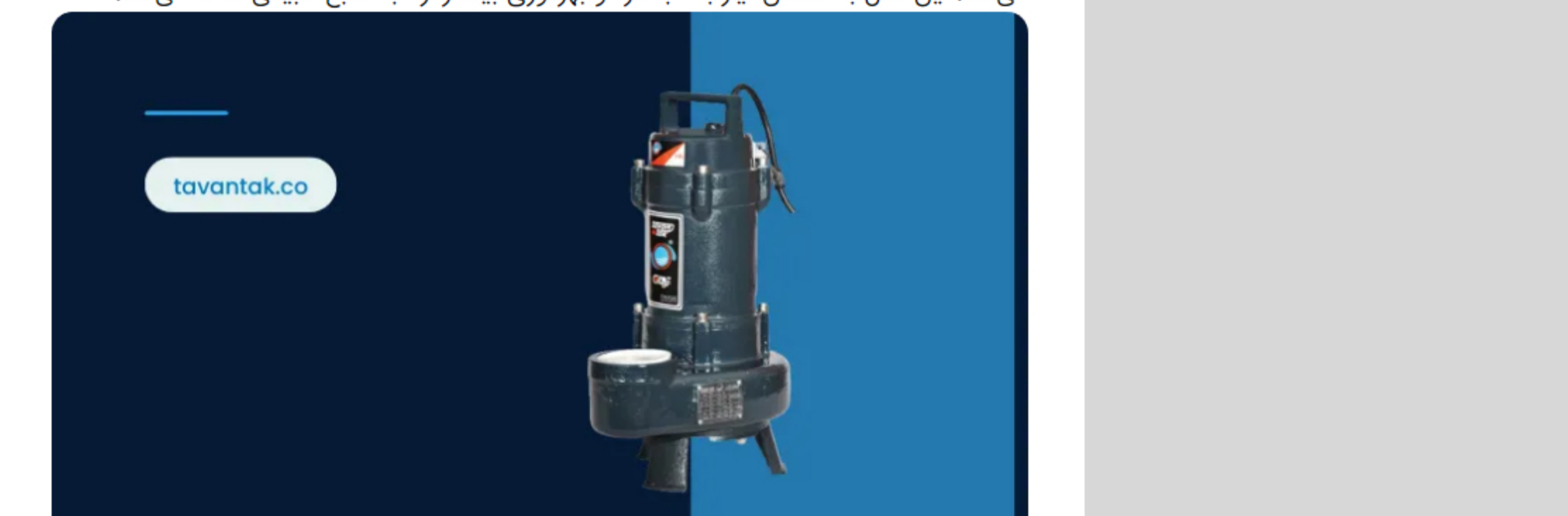
انواع کف کش فاضلابی چیست؟

در جمع آوری فاضلاب نقش کف کش فاضلابی چیست ؟ باید گفت که پمپ های کف کش فاضلابی توان تک نقش بسیار مهمی در جمع‌آوری فاضلاب دارد و یکی از ابزارهای حیاتی در مدیریت فاضلاب می‌باشد. این تجهیزات به طور گسترده در سیستم‌های فاضلاب شهری و مناطق مختلف مورد استفاده قرار می‌گیرند و وظیفه جمع‌آوری فاضلاب از منابع مختلف را بر عهده دارند. در ادامه به بررسی این تجهیزات مهم کف کش فاضلابی در جمع‌آوری فاضلاب اشاره می‌کنیم: جمع‌آوری فاضلاب: نقش اصلی کف کش فاضلابی، جمع‌آوری فاضلاب از سطح‌های مختلف محیط است. این تجهیزات در خیابان‌ها، پارک‌ها، میدان‌ها، ساختمان‌ها و دیگر مناطق عمومی نصب می‌شوند تا فاضلاب‌ها را به سمت سیستم‌های تصفیه فاضلاب هدایت کنند. جلوگیری از آلودگی محیط زیست: کف کش فاضلابی با جمع‌آوری فاضلاب و جلوگیری از تخلیه آن به طور غیرقانونی به محیط زیست، به کاهش آلودگی آب‌های سطحی و زیرزمینی کمک می‌کند. این عمل به حفظ کیفیت منابع آب و حیات دریا و زمین کمک می‌کند. تضمین بهداشت عمومی: با جلوگیری از تخلیه فاضلاب به محیط زیست و آب‌های عمومی، کف کش فاضلابی به بهداشت عمومی جامعه کمک می‌کند. این اقدام از شیوع بیماری‌های منتقله از آب جلوگیری می‌کند و سلامت افراد را تضمین می‌کند. مدیریت منابع آب: با کاهش و تصفیه فاضلاب، کف کش فاضلابی با منابع بهتر منابع آبی کمک می‌کند. این عمل به کاهش نیاز به آب تازه و بهبود بهره‌وری بیشتر از آب منابع طبیعی کمک می‌کند.