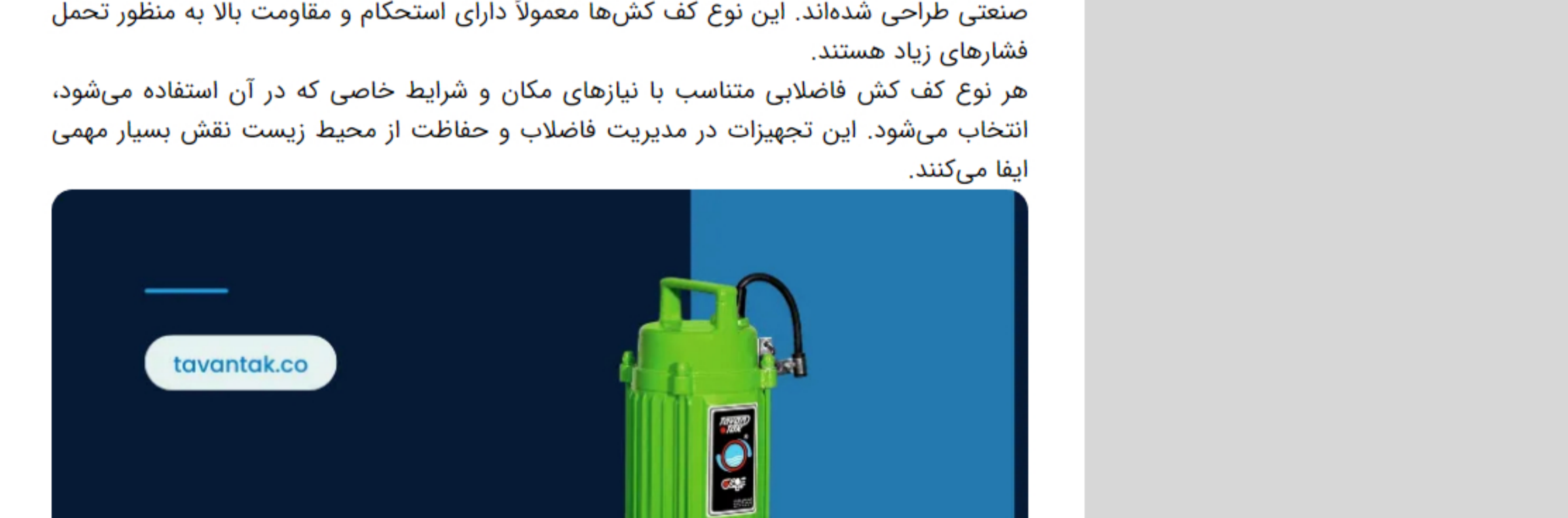
مزایای استفاده از کف کش فاضلابی چیست؟

انواع مختلف کف کش فاضلابی چیست ؟ کف کش فاضلابی در انواع مختلفی برای استفاده در مکان‌ها و شرایط مختلف تولید می‌شوند. هر نوع کف کش فاضلابی ویژگی‌ها و کاربردهای خاص خود را دارد. در ادامه به برخی از انواع کف کش فاضلابی اشاره می‌کنیم: کف کش‌های شهری: این نوع کف کش فاضلابی در خیابان‌ها، میدان‌ها، پارک‌ها و مناطق عمومی نصب می‌شوند. طراحی آنها به گونه‌ای است که از ظاهر زیبا و متناسب با محیط شهری برخوردارند و همچنین قابلیت جمع‌آوری فاضلاب را دارا هستند. کف کش‌های ساختمانی: در ساختمان‌ها و اماکن تجاری نیز از کف کش فاضلابی استفاده می‌شود. این نوع کف کش‌ها معمولاً در محیط‌های داخلی و خارجی ساختمان‌ها نصب می‌شوند و به جمع‌آوری فاضلاب و پیشگیری از عوامل ایجادکننده لغزش کمک می‌کنند. حتماً قبل از خرید و استفاده قیمت پمپ کف کش ، به دقت مزایای آن را بررسی کنید. کف کش‌های صنعتی: برای محیط‌های صنعتی با بار ترافیک سنگین و شرایط سخت، کف کش‌های صنعتی طراحی شده‌اند. این نوع کف کش‌ها معمولاً دارای استحکام و مقاومت بالا به منظور تحمل فشارهای زیاد هستند. هر نوع کف کش فاضلابی متناسب با نیازهای مکان و شرایط خاصی که در آن استفاده می‌شود، انتخاب می‌شود. این تجهیزات در مدیریت فاضلاب و حفاظت از محیط زیست نقش بسیار مهمی ایفا می‌کنند.