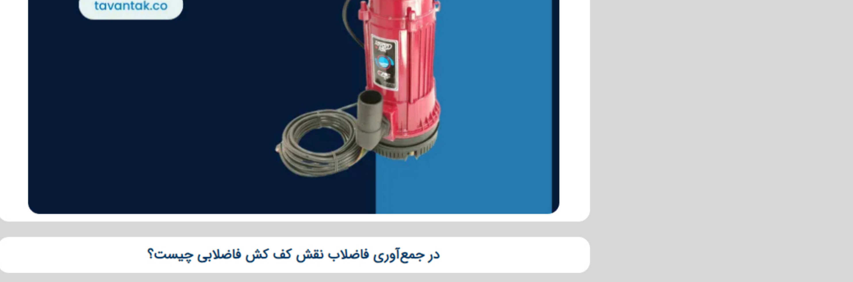
در جمع‌آوری فاضلاب نقش کف کش فاضلابی چیست؟

در نتیجه، دستگاه پمپ کف کش فاضلاب نقش بسیار مهمی در مدیریت فاضلاب ایفا می‌کند و به حفظ محیط زیست و بهداشت عمومی کمک می‌کند. بنابراین، توجه به نصب و نگهداری این دستگاه‌ها و استفاده از آنها به عنوان یکی از ابزارهای مؤثر در مدیریت فاضلاب بسیار حیاتی است.